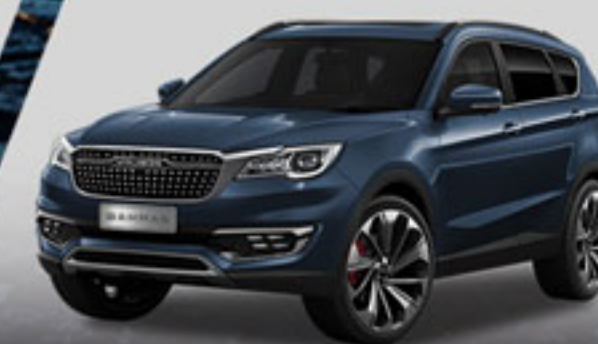
خاکستری کهکشانی Galaxy Grey