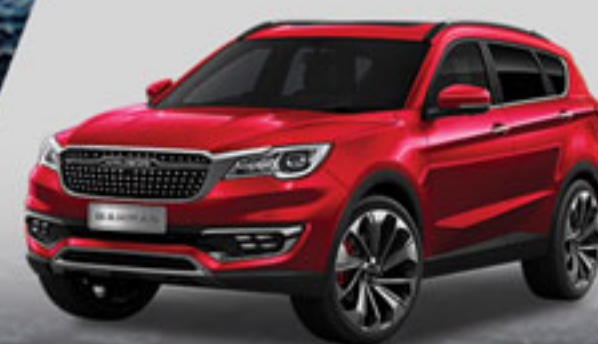
قرمز روناسی Ronass Red