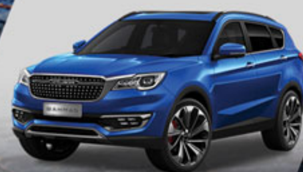
آبی اطلسی Atlantic Blue