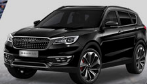
مشکی یاقوتی Sapphire Black