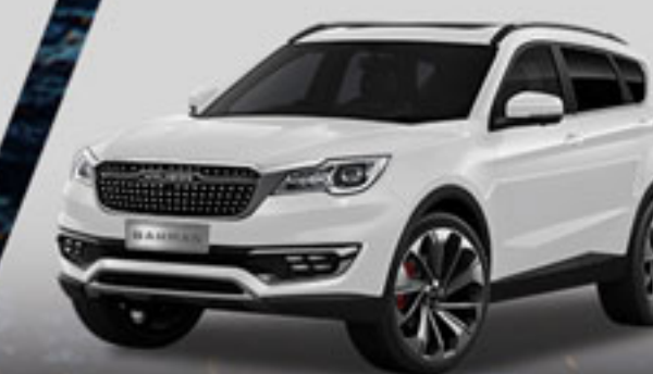
سفید دماوندی Damavand White

آدرس: تهران، کیلومتر ۱۳ بزرگراه لشکری (جاده مخصوص کرج)، پلاک ۲۷۹، کد پستی: ۱۳۹۹۹-۳۹۷۱۱ | ۰۲۱-۴۸۰۲۷ | www.bahman.ir