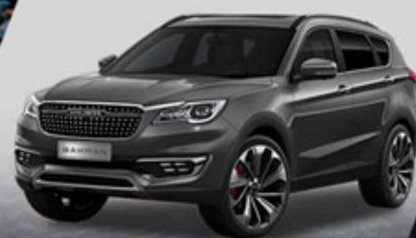
خاکستری گرافیتی Graphite Grey